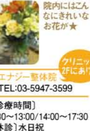
クリニック2Fにあり!

言葉の使い方に気をつけてお話すようにしています。的を得つつもなるべく分かりやすく、また患者さんの気持ちを汲んだ言い方を大切にしています。