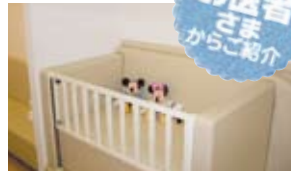
ベビーベッドあり!