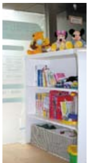
プレイルームあります!

休日の過ごし方 ● 家族と過ごす。趣味 ● 時代小説を読む ● ゲンキのモト ● 子供と遊ぶこと。ちなみに9歳と5歳のお子さんがいらっしゃる2児のお父さん